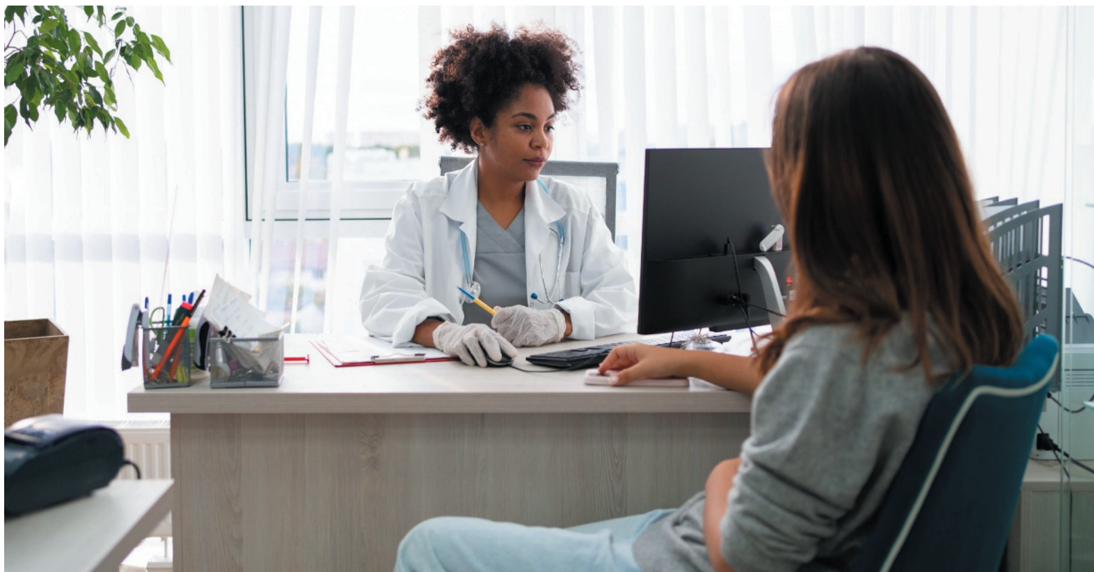
No Brasil, gasto vai passar dos R$ 236,4 bilhões, conforme indica Pesquisa IPC Maps